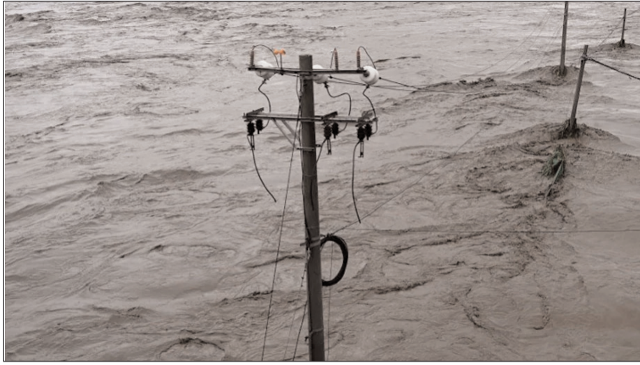
reporters saw muddy debris strewn across the road.

Swaths of suburban Beijing remain badly hit by the rains -- some of the city's heaviest in years. On the banks of the Mentougou river, one of the worst affected areas, AFP