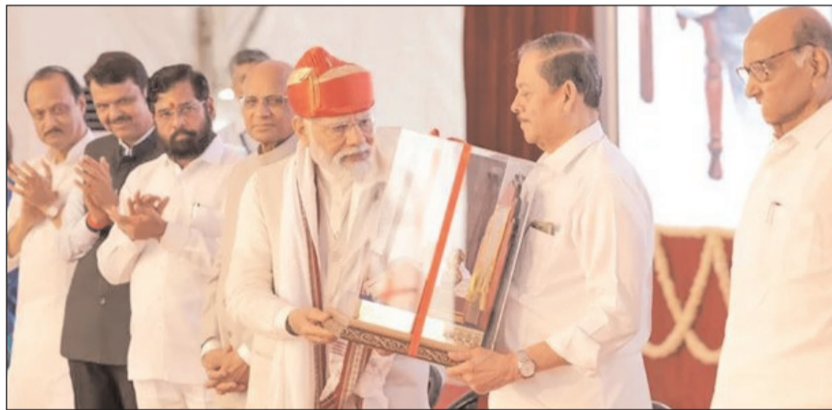
The PM paid floral tributes at the statue of Lokmanya Tilak after arriving at the venue. Addressing the gathering, the Prime Minister paid tributes to Lokmanya Tilak on his punya tithi and said that it is a special day for him.

The Prime Minister paid floral tributes at the statue of Lokmanya Tilak after arriving at the venue. Addressing the gathering, the Prime Minister paid tributes to Lokmanya Tilak on his punya tithi and said that it is a special day for him. Highlighting his feelings for the occasion, the Prime Minister said that today marks the punya tithi of Lokmanya Tilak and the birth anniversary of Anna Bhau Sathé. "Lokmanya Tilak ji is the 'tilak' of India's freedom struggle", the Prime Minister said. He also underlined the extraordinary and