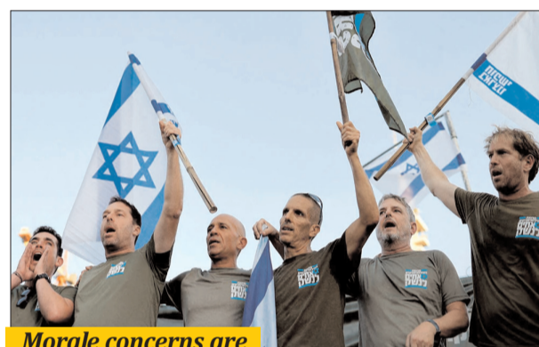
Morale concerns are emerging within the Mossad with some inside the highly secretive agency considering early retirement.

Some serving Mossad officers have also joined the protests, which they are permitted to do, two ex-offi-