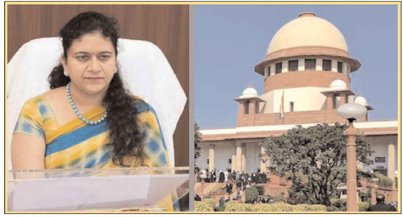
On Monday, the top court observed that it has become a routine affair that Uttar Pradesh officials are approaching it against the Allahabad High Court orders

The senior IAS officer, who is posted as the Chief Executive Officer of New Okhla Industrial Development Authority (NOIDA), has moved the top court against.