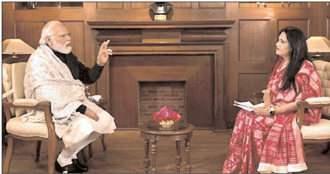
"BJP believes in collective leadership," PM Modi said

"When we are in power, then with great energy and on a large scale we work with the mantra 'Sabka Saath, Sabka Vikas' (with everyone's participation, we ensure the development of all)," the Prime Minister said with political spheres in